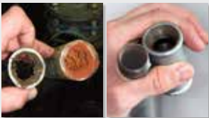
Sistema de tuberías