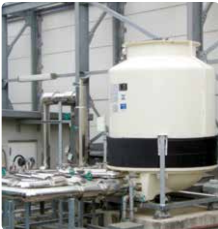
Torre de refrigeración