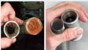
Sistema de tuberías