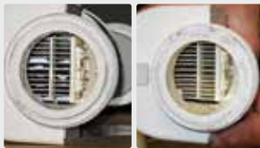
Filtro de piscina