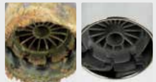
Grifo de agua