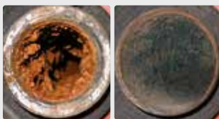
Sistema de tuberías