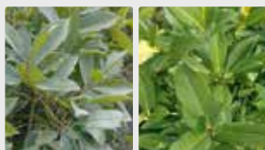
Plantas y césped