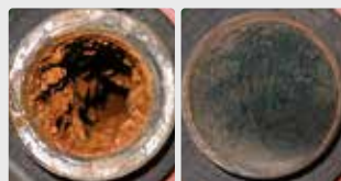
Biopelícula en un sistema de tuberías